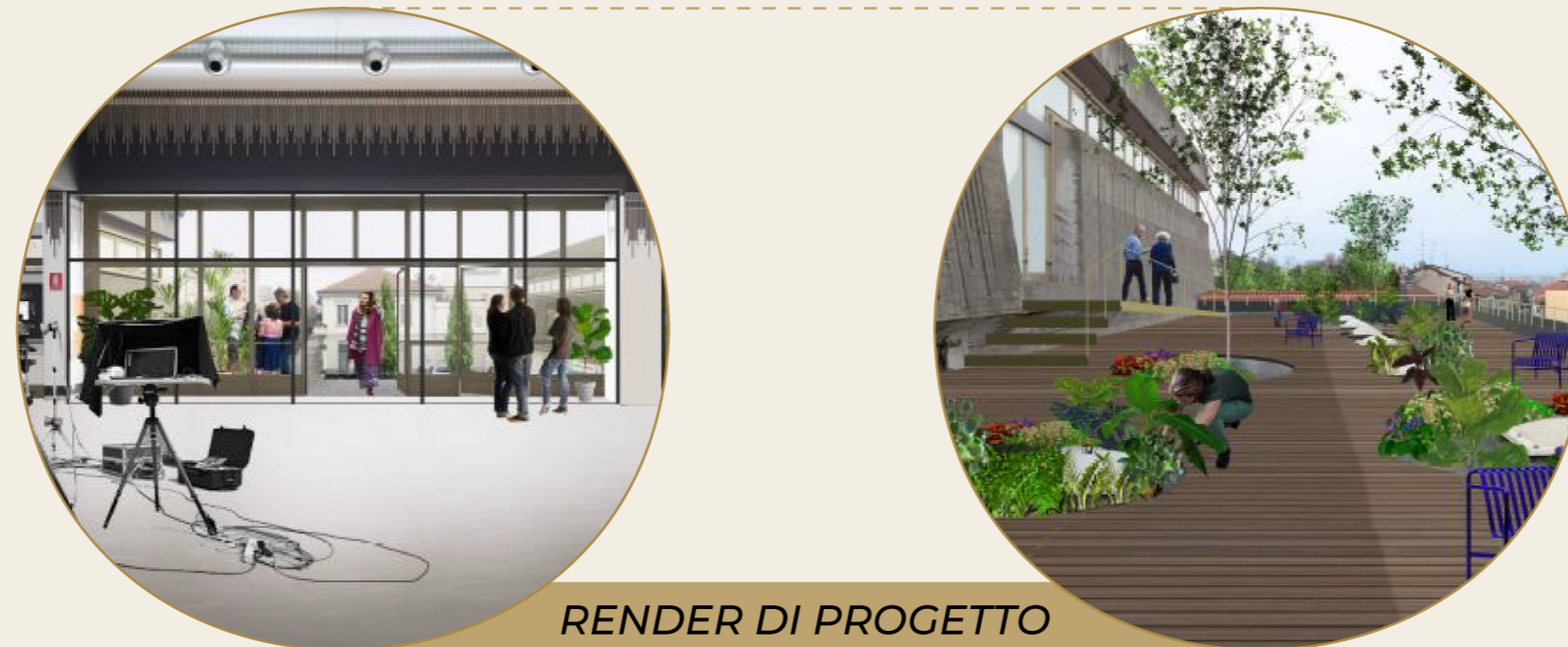
RENDER DI PROGETTO